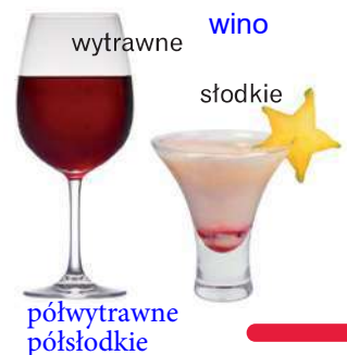
wytrawne wino słodkie półwytrawne półsłodkie