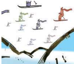
jeździć na nartach